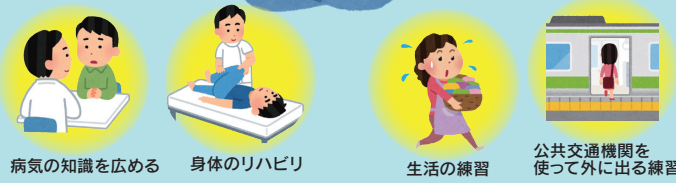
病気の知識を広める 身体のリハビリ 生活の練習 公共交通機関を使って外に出る練習